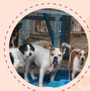
30-Day Shelter (MBI)