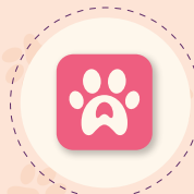
Perak Pawsitive App