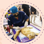
Program Pemandulan Anjing & Kucing Bersubsidi